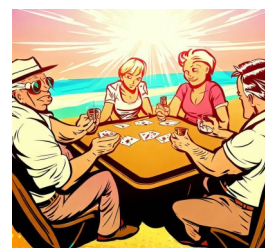
L'été à Bridge Académie

La F.F.B ainsi que le comité des Pyrénées ont augmenté les tarifs de manière significative, la licence, le prix des compétitions ainsi que les « points d'expert », un joli nom désignant la taxe payée par les clubs à chaque fois que quelqu'un participe à un tournoi de régularité. Si on y rajoute l'inflation ainsi que la flambée de l'énergie, le club doit aug-