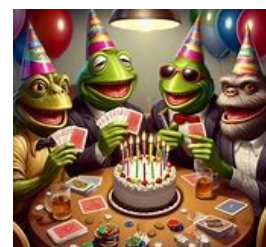
Bon anniversaire bridgac !

Dans les nouveautés récentes, la sortie du SEF 2024, cet ouvrage qui sort tous les six ans, apporte son lot de nouveautés habituelles. La plupart vous étaient déjà conseillées par vos professeurs préférés et vous pouvez retrouver certaines d'entre elles (2SA fitté